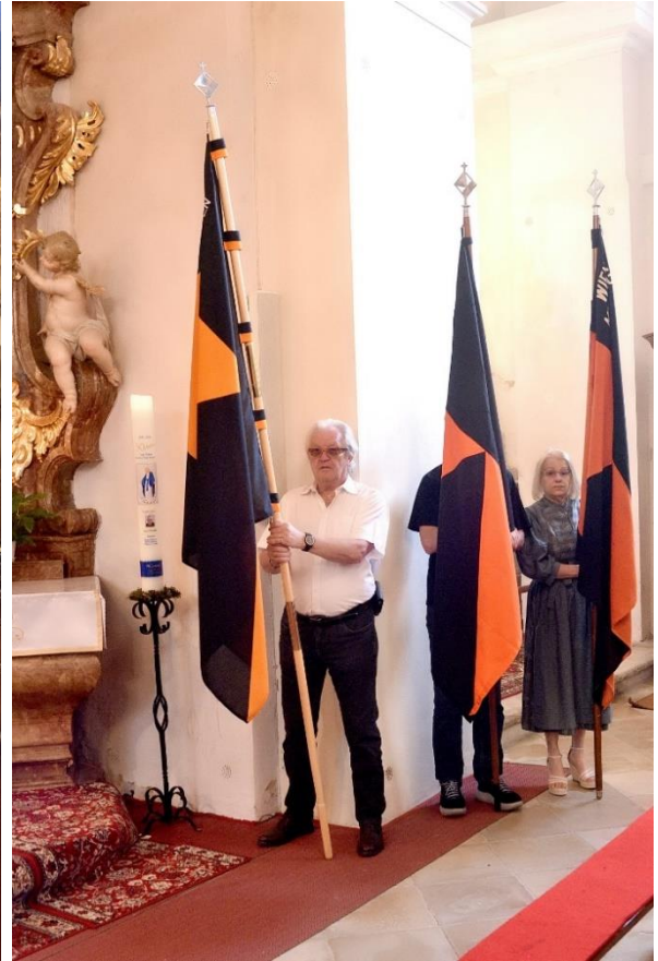
Einzug in die Kirche mit unseren Kolpingfahnen